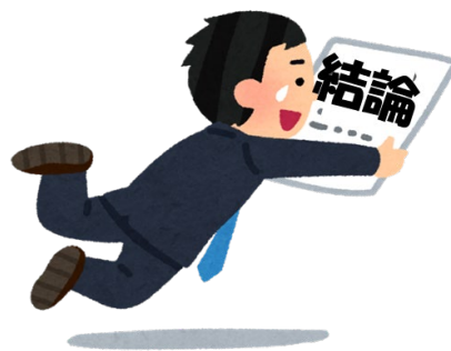
図1. 結論への飛躍のイメージ (宮崎大学・平野羊嗣准教授のご厚意による)

妄想を持つ患者さんでは、健康な方に比べてより少ない情報にもとづいて結論を下す、「結論への飛躍 (jumping to conclusions)」(図1) と呼ばれる認知的な傾向があることが知られており、このために誤った考えに至りやすい、つまり妄想の形成しやすさを説明するメカニズムと考えられています。また健康な方の場合は逆に、結論を下すためには客観的な確率が示すよりも多くの情報を要するという「保守性バイアス (conservatism bias)」と呼ばれる傾向が知られていません。結論への飛躍と保守性バイアスに関わる脳神経領域を探る研究がこれまで行われてきましたが、はっきりした結論には至っていませんでした。